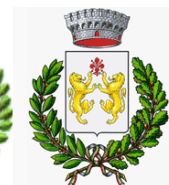
Comune di Poppi