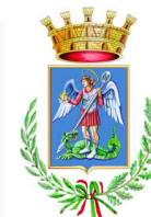
Comune di Castiglion Fiorentino